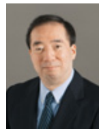
清家 篤 慶應義塾長

慶應義塾大学商学部教授、慶應義塾長。博士(商学)。専攻は労働経済学。1978年、慶應義塾大学経済学部卒業。同大学大学院商学研究科博士課程修了、同大学商学部助教授を経て、1992年より同教授。2007年より商学部長、2009年より慶應義塾長。この間ランド研究所研究員、経済企画庁経済研究所客員主任研究官等を歴任。現在、労働政策審議会委員(厚生労働省)などを兼務。近著に『エイジフリー社会を生きる』NTT出版(2006年)、『高齢者就業の経済学』(共著)日本経済新聞社(2004年、2005年の第48回日経・経済図書文化賞受賞)、『労働経済』東洋経済新報社(2002年)などがある。