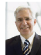
Bodo B. Schlegelmilch 氏 ウィーン経済大学 教授

(堀木エリ子&アソシエイツの公式ページ http://www.eriko-horiki.com/ )